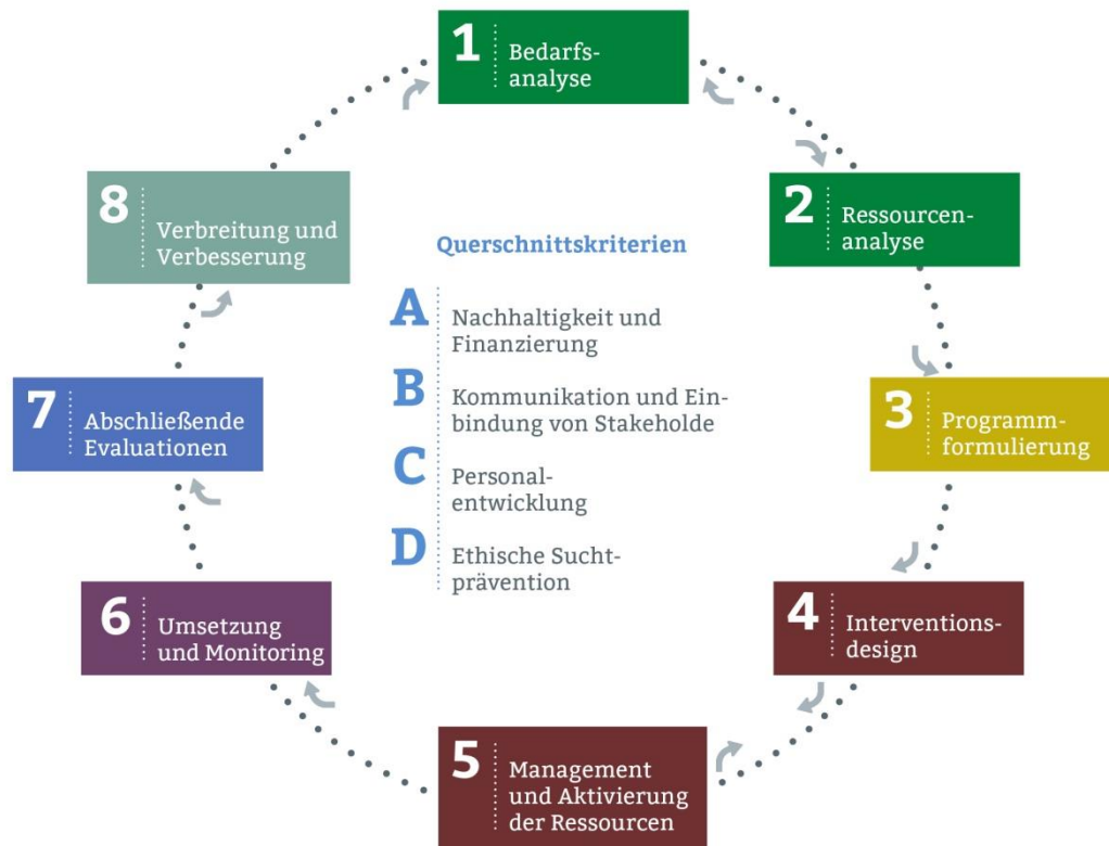
Abbildung 1: Der suchtpreventive Projektzyklus.

Der Projektzyklus besteht aus acht Phasen plus vier Querschnittskriterien . Er ist ein vereinfachtes Modell suchtpreventiver Arbeit, das Fachkräfte sorgfältig an ihre jeweiligen Arbeitskontexte anpassen sollten. Jede Projektphase ist in mehrere Module unterteilt, die umreißen, welche Arbeitsschritte wichtig sind. Insgesamt gibt es 31 Module über alle Phasen hinweg sowie vier Module innerhalb der Querschnittskriterien (s. Abb. 2).